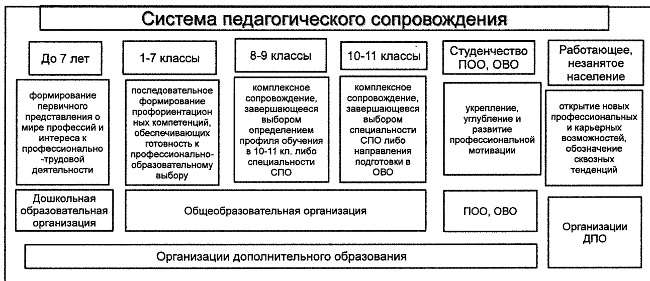
Рисунок 1. Модель педагогического сопровождения профессионального самоопределения обучающихся

В качестве конкретизированных объектов модели педагогического сопровождения профессионального самоопределения обучающихся выделены основные возрастные образовательные группы, с которыми возможна работа по психолого-педагогическому сопровождению профессионального самоопределения (рис. 1).